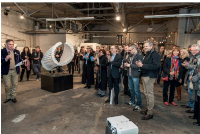
Rundblick 2012, DQE Design Quartier Ehrenfeld, Foto: Peter Kierzkowski