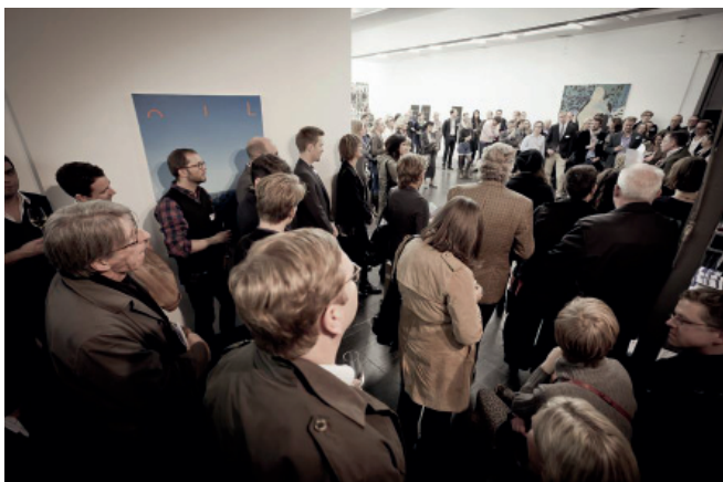
Rundblick 2011, Temporary Gallery Cologne, Foto: Peter Kierzkowski