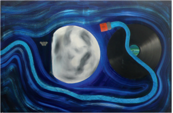
Simon Hemmer; ohne Titel, 2012; 90 x 140 cm; Öl auf Leinwand